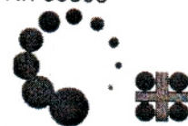
VSA Verband Schweizer Abwasser- und Gewässerschutzfachleute